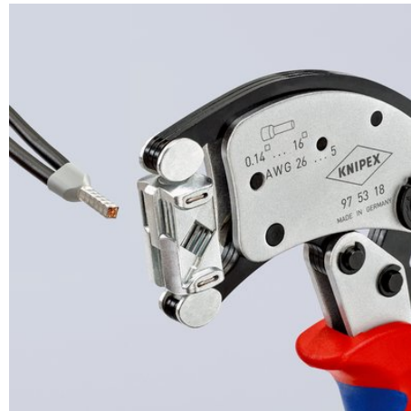
360° dreibart presshode for beste tilgjengelighet også under trange forhold